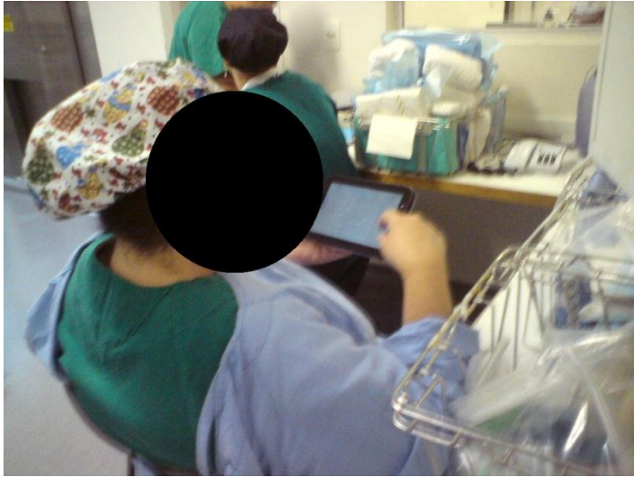
Figura 7. Profissional de Enfermagem da CME participando do curso “Higienização das mãos e uso de luvas” .