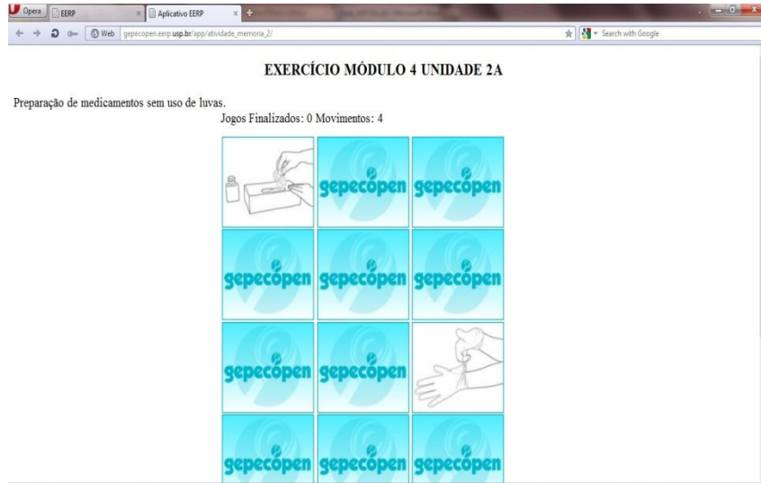
Figura 6. Layout do jogo da memória referente ao curso “Higiene das mãos e uso de luvas”.