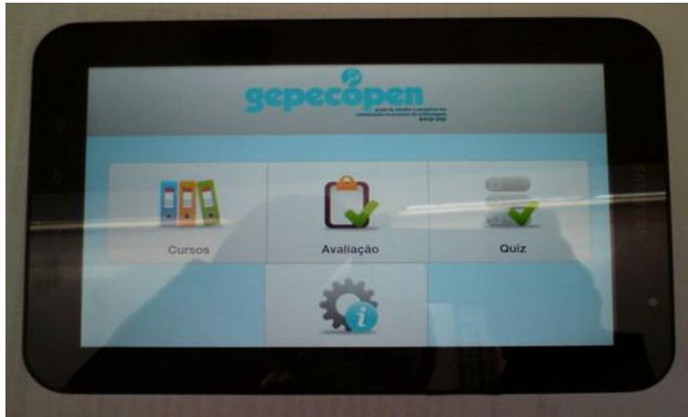
Figura 2. Dispositivo móvel utilizado para EP dos profissionais de enfermagem de uma instituição hospitalar do interior do Estado de São Paulo, Brasil.

Estudo exploratório-descritivo do tipo Survey e transversal de intervenção com delineamento do tipo pré e pós-teste.