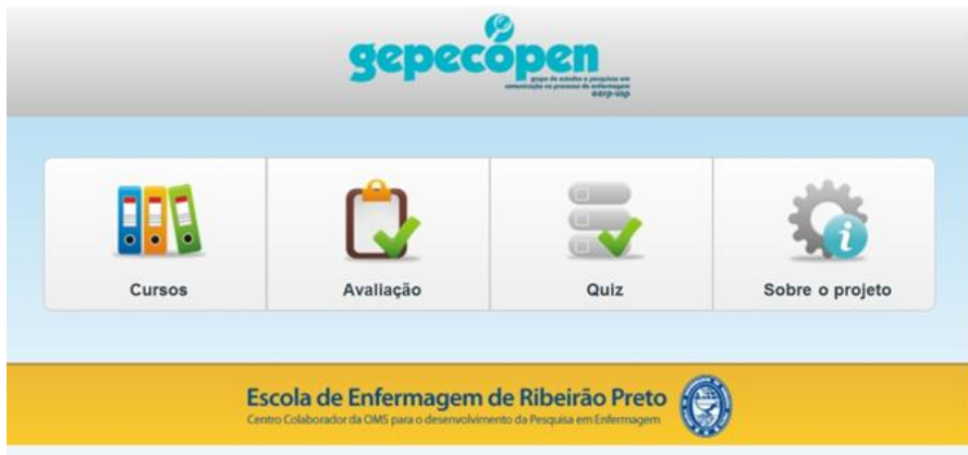
Figura 5. Interface do ambiente de aprendizagem do curso “Higienização das mãos e uso de luvas”.