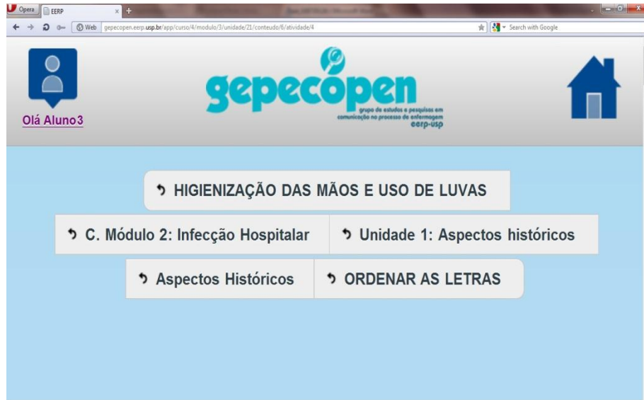
Figura 3. Layout do ambiente de aprendizagem do curso “Higiene das mãos e uso de luvas”